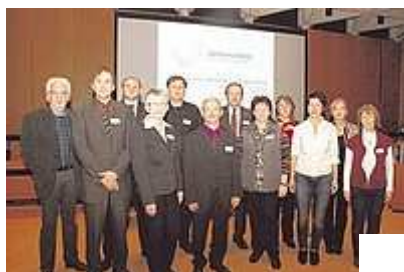
Vernetzt in Sachen Demenz (von links):

Minden/Lübbecke (mt/ani). Die Zahl der an Demenz erkrankten Menschen in Deutschland steigt kontinuierlich an. Folglich müssen sich auch die Hilfsangebote vor Ort weiterentwickeln.